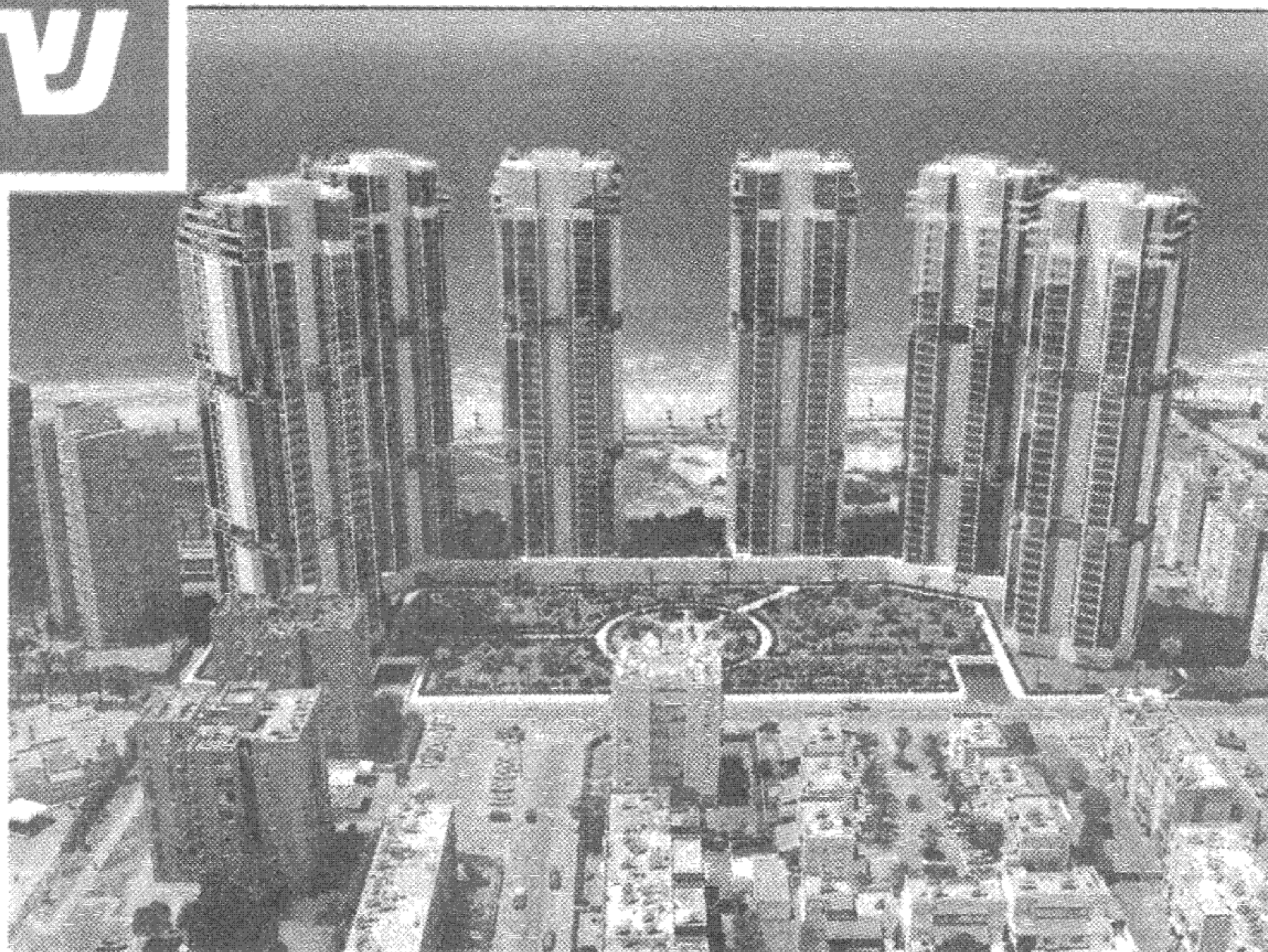
הדמיה יכולה להפוך לחציאות. קרית ים