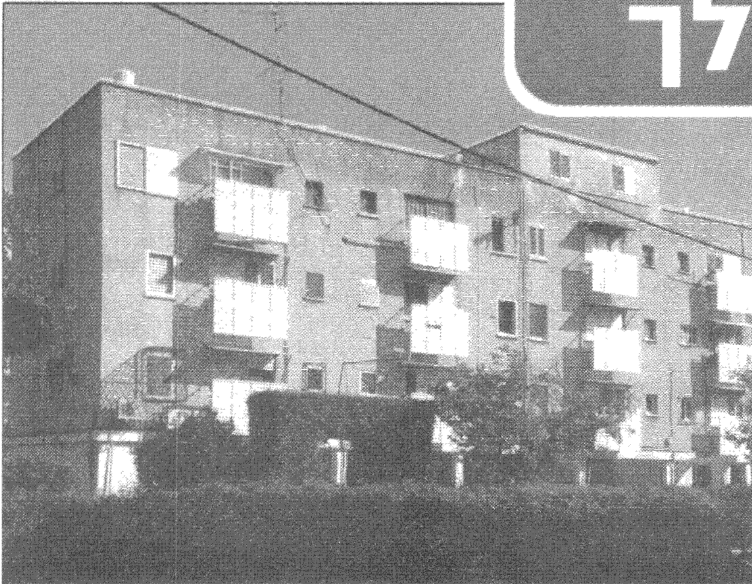
יוצא בקרוב לדרך. יוספטל מוצקין