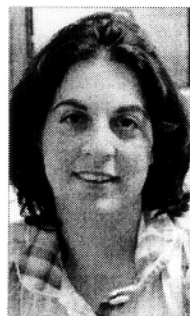
קרן לוי חפץ

נושא: משפט ימי תאריך: 11/11/2012 כתב: עו"ד קרן לוי חפץ מייל ישיר לכתב: עו"ד קרן לוי חפץ