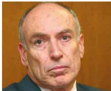
ישראל לשם ממיתר